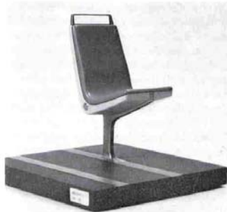
Sitz für Nahverkehrsmittel - DM 5000.

sam und mit ein wenig Geduld betrachten - nicht nur das Endergebnis -, sondern gerade all die Überlegungen verfolgen, die zu diesem Ergebnis geführt haben, dann werden Sie sicher spüren, wieviel Mut, Fleiß, Begabung und Begeisterungsfähigkeit hinter diesen Arbeiten stecken.