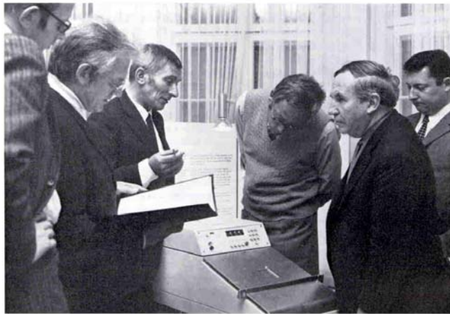
Die Jury - von Sachverständigen beraten - bildet sich ihr Urteil.

Als der Braun-Preis in Zusammenarbeit mit dem Gestaltkreis im Bundesverband der Deutschen Industrie im Jahre 1967