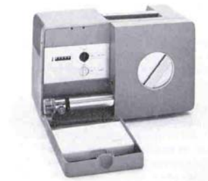
Hochdruckinjektor - DM 5000 (oben) und verstellbarer Waschtisch - DM 5000 (links).